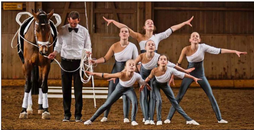
Das Team 1 des Voltige Team Emme.