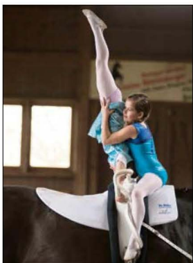
Team 1 auf Quasimodo (links) und Team 2 auf Ramello.